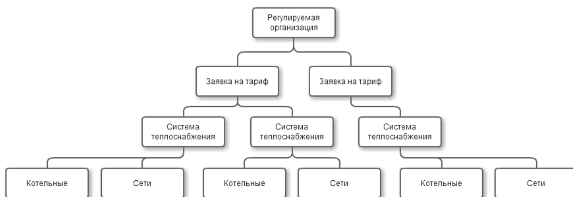
Рисунок 1 - Уровни СТ

В него входит выбор метода регулирования, формирование систем теплоснабжения (далее – СТ), формирование заявок на тариф и сбор данных для расчета методом аналогов (в случае, если будет выбран этот метод) (Рисунок 1).