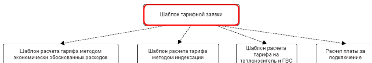
Рисунок 3 - Схема шаблонов